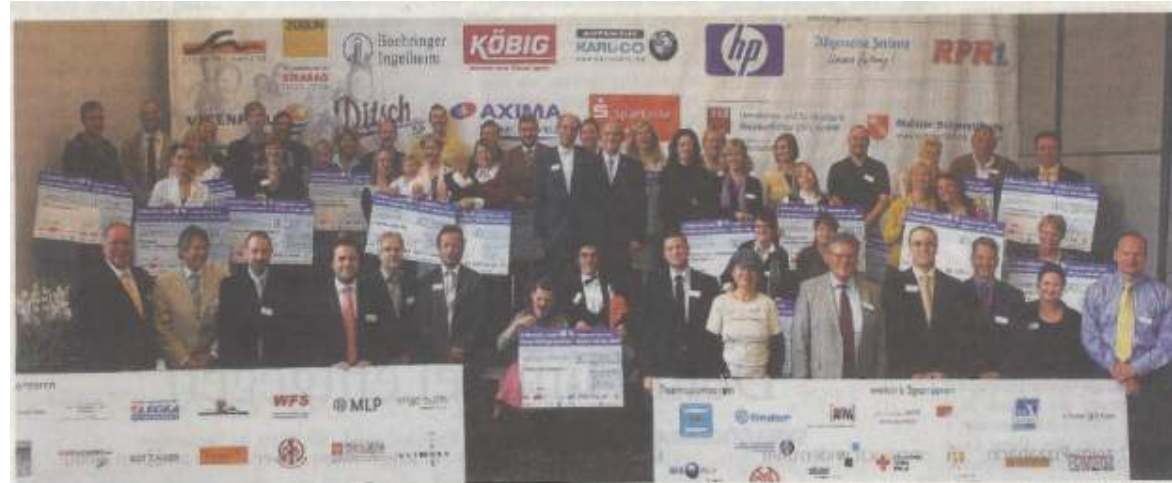
Viele Organisationen profitieren von der enormen Summe, die beim „Run for Children“ erlaufen wurde.