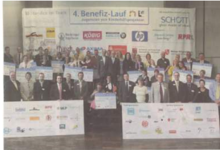
Dankbar nahmen die Vertreter der Hilfsvereine und -organisationen ihre Spendenschecks entgegen.