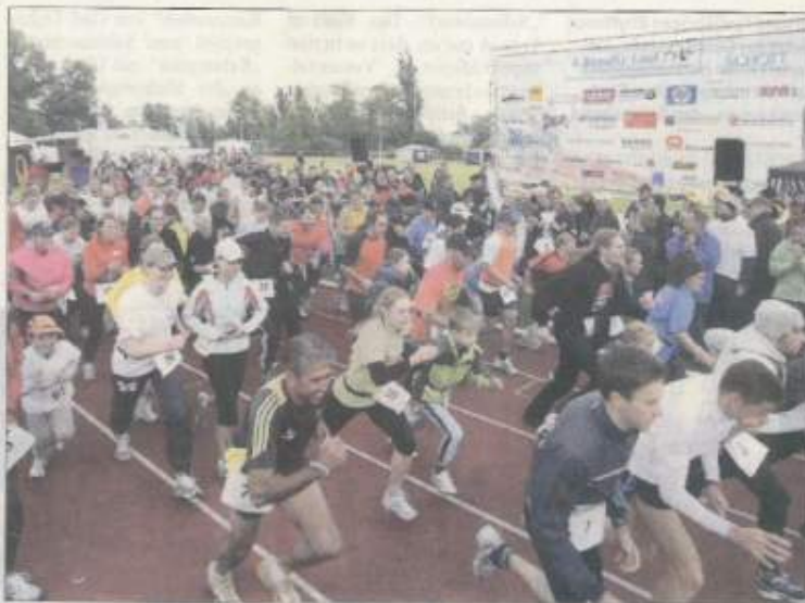
Um 11 Uhr fiel der Startschuss für die 82 teilnehmenden Teams. Zehn Stunden später war klar: Die Teilnehmer liefen zusammen eine Strecke von 10 469 Kilometern, was der Entfernung von Mainz nach Singapur entspricht.

Zum vierten Mal fand der Lauf auf Initiative der Schott AG statt, die mit den eingenommenen Spenden über 35