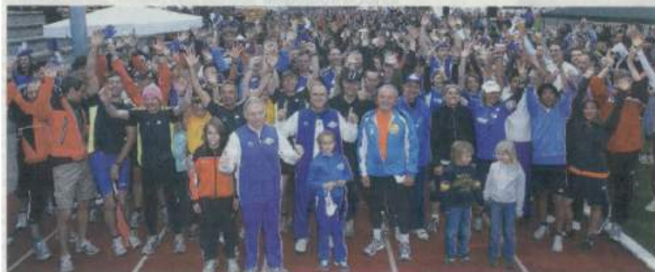
1 800 Läufer sorgen beim Run for Children für einen Spendenerlös von 107 000 Euro.